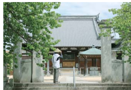
四国八十八カ所の霊場の 56 番泰山寺までは、家族に先立たれた悲しみを胸に抱いて霊場を巡るお遍路さんと道連れになった。四国霊場巡りは心の癒しの場でもある。