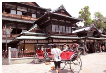
道後温泉の中には道後温泉本館。共同浴場になっている。明治時代から続くといわれ、天皇の間なども残る。名作「坊っちゃん」のマドンナが乗ったという人力車が、若い人に人気だ。

●道後温泉・古湧園 TEL 089-945-5911 愛媛県松山市道後鶴谷町 1-1 1泊2食1万1700円(税別)から *交通 JR 予讃線松山駅→私鉄伊予鉄道 JR 松山駅から道後温泉行き約25分 道後温泉駅下車→徒歩約10分