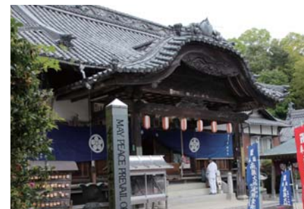
四国八十八カ所の霊場は、四国四県にまたがり、今日も杖を手にした白衣の巡拝者が多い。四国の旅の大きなポイント。54 番延命寺からスタートして今治、松山を巡った。